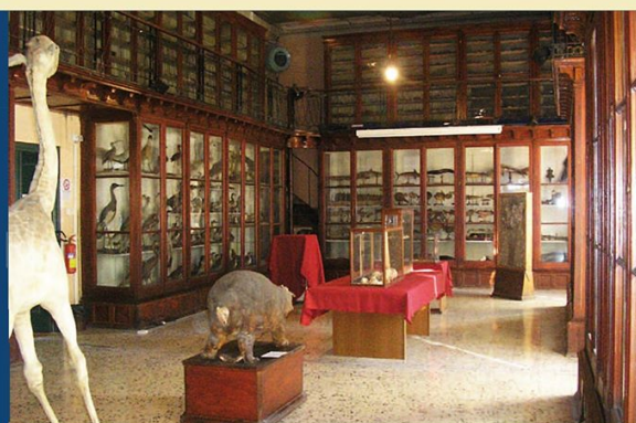
ATTI DEL CONVEGNO